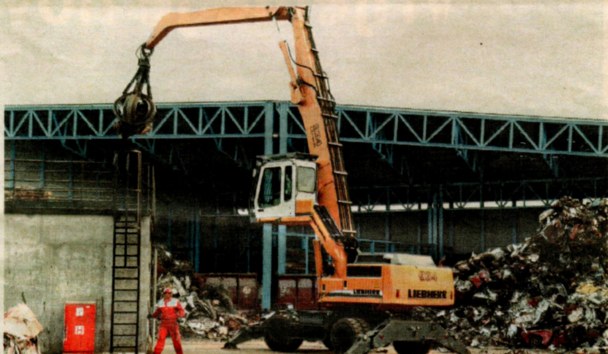
Novi pogon kapacitetom će zadovoljiti potrebe prerade sekundarnih sirovina u riječkom kraju u idućih 30 godina

Investicije C.I.O.S.-ova tvrtka Metis lani je isporučila 85.000 tona sirovina